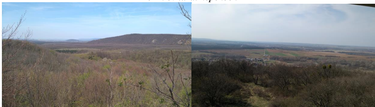
Vértes; kis tisztás