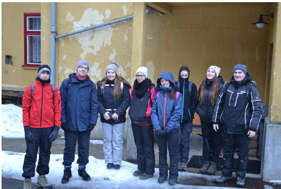
1. kép. A nagy csapat.

Másnap tette készen, jól felöltözve, élelemmel és innivalóval felszerelve elindultunk a lazábbnak vélt Zöld-tavi Menedékházhoz vezető túránkra.