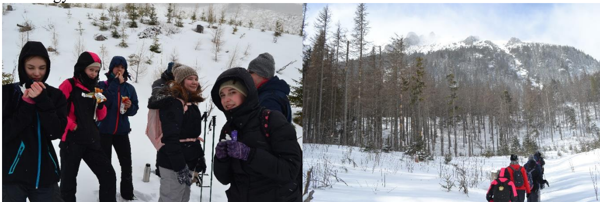
2.-3. ábra. Energiagyűjtés a tovább haladáshoz.