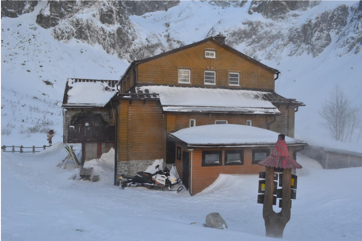
4. ábra. A Zöld-tavi Menedékház.

szívfájdalmunkra hamar vissza kellett indulnunk, hogy még sötétedés előtt a szállásra érjünk, mivel a 10 órát is meghaladó kiruccanás az időjárás miatt túl hosszú sikerült. Visszatérve a szállásunkra már csak néhány dologra vágytunk, úgymint a forró zuhanyzás, a meleg ételek és az ejtőzés. Az alvással ezúttal nem volt probléma, a fáradtságtól szinte beajultunk az ágyainkba.