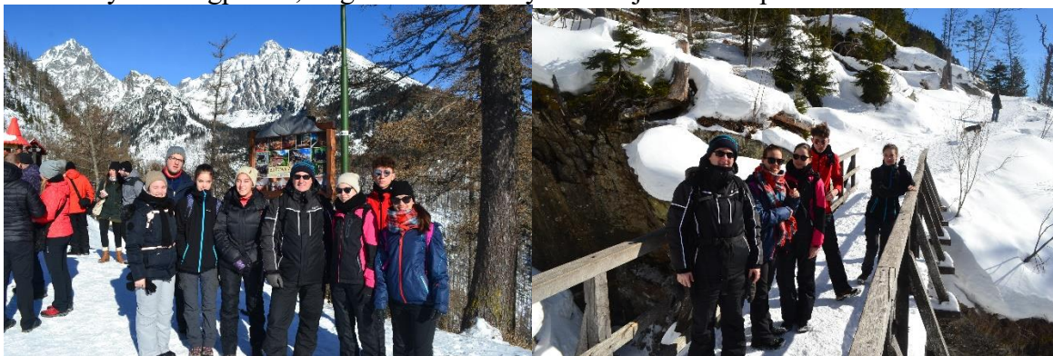
5- 6. kép. A Tarpataki-vízeséshez menet.