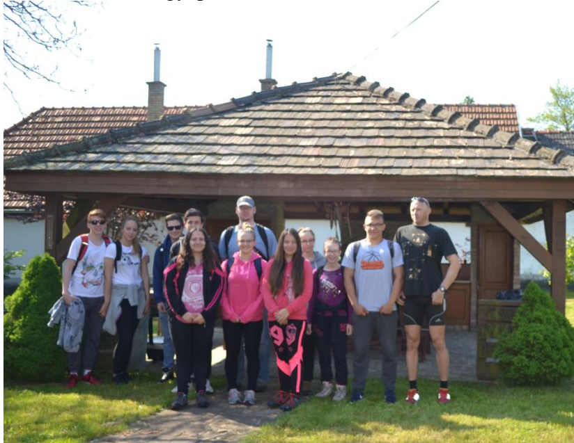
Indulás az Eperjesre