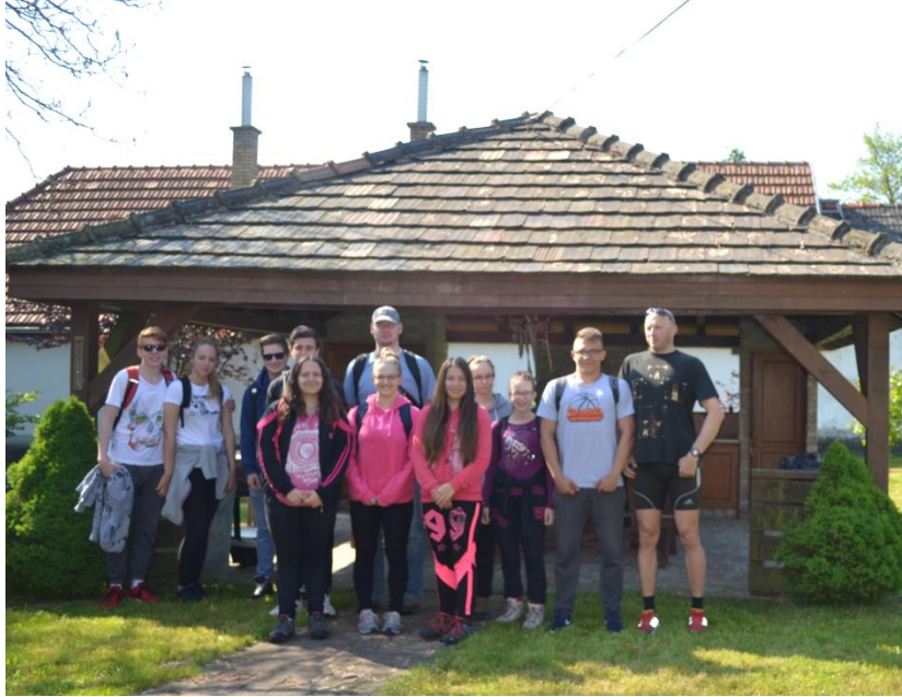
Indulás az Eperjesre