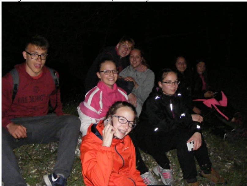
Éjszaka a terepen

A program egyik legizgalmasabb része az éjszakai túra volt, mely során egy közeli magaslatra kellett eljutni az erdőn keresztül, holdfényben.