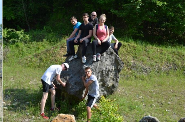
...és lent a régi kőfejtőben